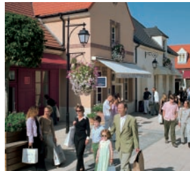
02 ラ・ヴァレ・ヴィレッジ