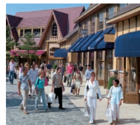
06 マースメヘン・ヴィレッジ