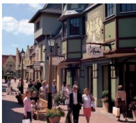
07 ヴェルトハイム・ヴィレッジ