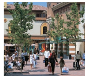
05 フィデンザ・ヴィレッジ