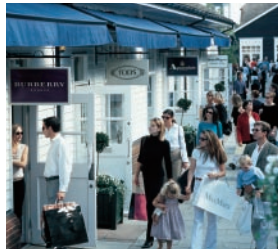
01 ビスター・ヴィレッジ

キルデア・ヴィレッジは、ヨーロッパ7カ国9都市に展開するシック・アウトレット・ショッピング®ヴィレッジのひとつです。どのヴィレッジも、高級ファッションやハウスウェア、アクセサリブランドなどを毎日最大60%OFFで提供。ヨーロッパの各主要都市から車で約1時間以内なので、オプション・ツアーに組みやすいのも特長です。ツアーをご企画の際には、どうぞお気軽にご連絡ください。