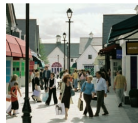
09 キルデア・ヴィレッジ