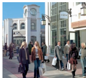
08 インゴルシュタット・ヴィレッジ