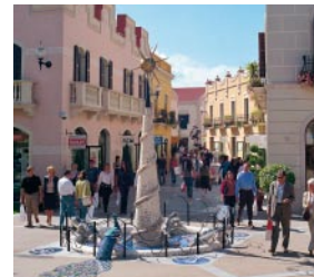
04 ラ・ロカ・ヴィレッジ