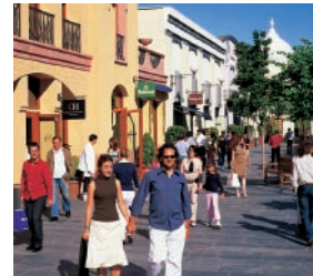
03 ラス・ロサス・ヴィレッジ